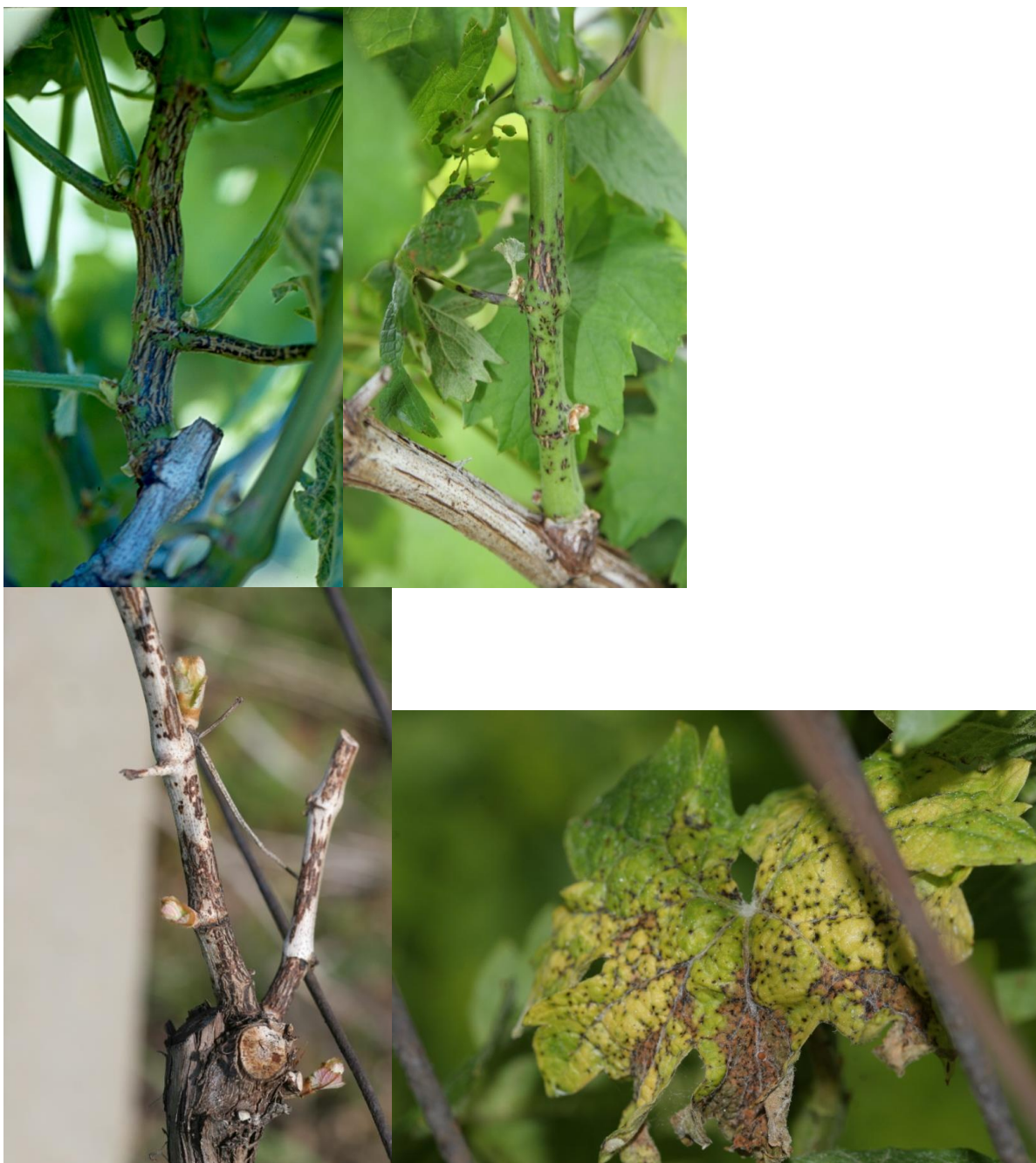
Slike 18,19,20,21: Črna pegavost vinske trte ( Phomopsis viticola ), (Foto: Jože Miklavc)