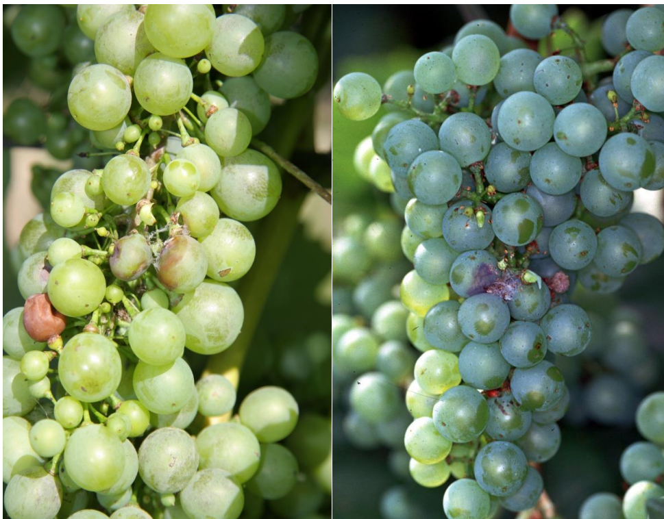
Sliki 10,11: Posledica napada grozdnih sukačev