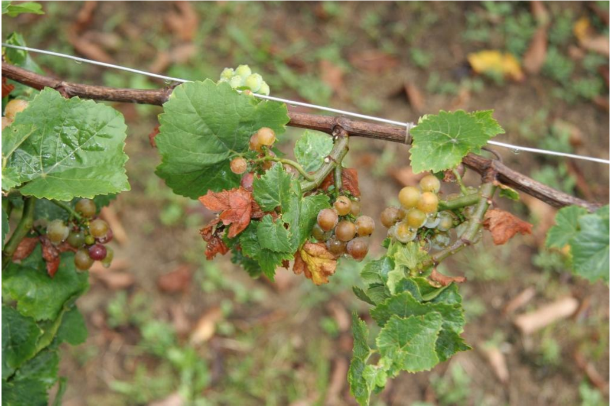
Slika 22: Grapevine Pinot gris virus