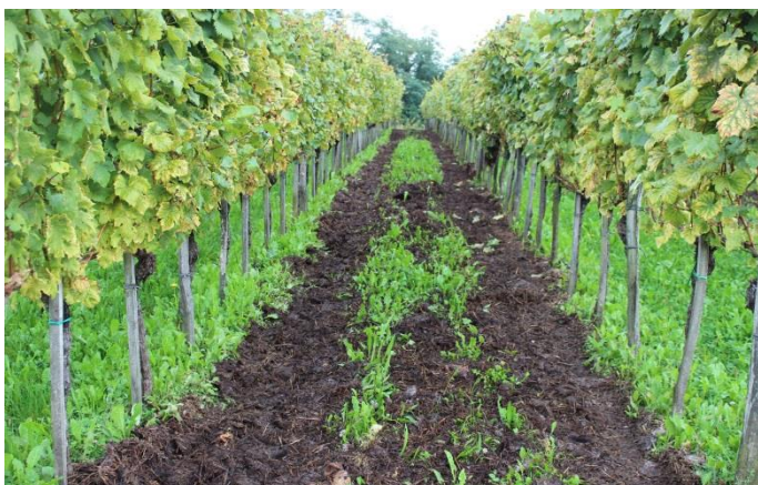
Slika 7: Gnojenje vinograda s hlevskim gnojem