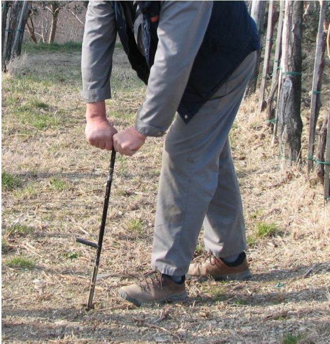
Slika 5: Jemanje vzorcev tal za kemijsko analizo