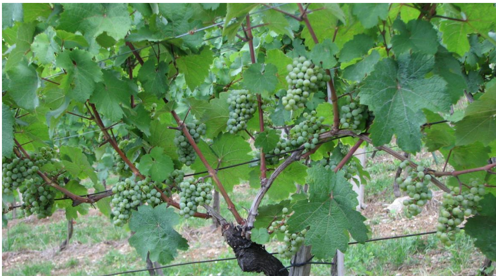
Slika 9: Po opravljenih zelenih delih

Vsa v nadaljevanju naštetá zelena dela so obvezen del tehnologije vinogradniške ekološke pridelave. Zahtevnost naštetih opravil dokazuje, da je ekološka pridelava v primerjavi z ostalimi oblikami pridelave po vloženem delu in znanju najbolj intenzivna kmetijska pridelava, ki za uspeh zahteva veliko več znanja sredstev in energije. Zato postaja ekološka pridelava tudi najbolj zanimivo področje za nove inovativne rešitve, kako ob absolutnem spoštovanju naravi, okolju in ljudem prijazne pridelave zagotoviti stabilno letino, v primerjavi z obstoječo konvencionalno pridelavo povsem konkurenčno in ekonomično pridelavo vrhunsko kakovostnih ekoloških vin.