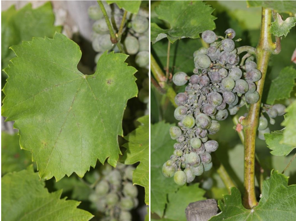
Sliki12,13: Oidij na listu in grozdu vinske trte.