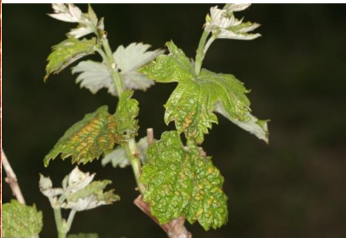
Slike 14,15,16,17: Trsna pršica šiškarica ( Eryophies vitis )