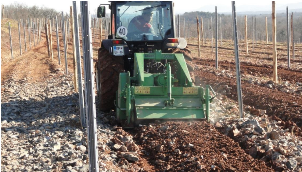
Slika 3: Drobljenje kamenja pred saditvijo.