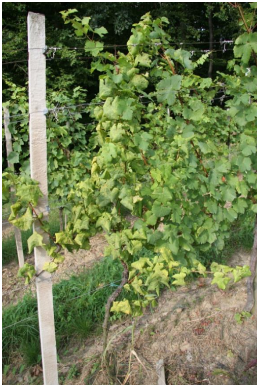
Slika 9: Zlata trsna rumenica