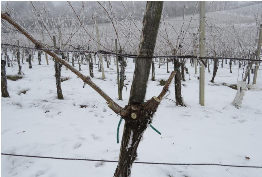
Slika 8: »mehka rez« v ekološkem vinogradu (brez velikih ran)

V ekoloških vinogradih so zakonitosti rezi povsem enake kot v ostalih vinogradih, s to razliko, da je pri rezi v ekološkem vinogradu treba za ta ukrep več časa in doslednosti pa tudi veliko več znanja.