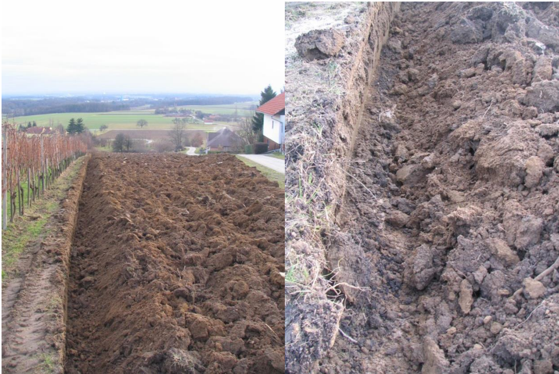
Slika 1,2: Zemljišče kjer je bilo rigolanje opravljeno s traktorskim plugom.