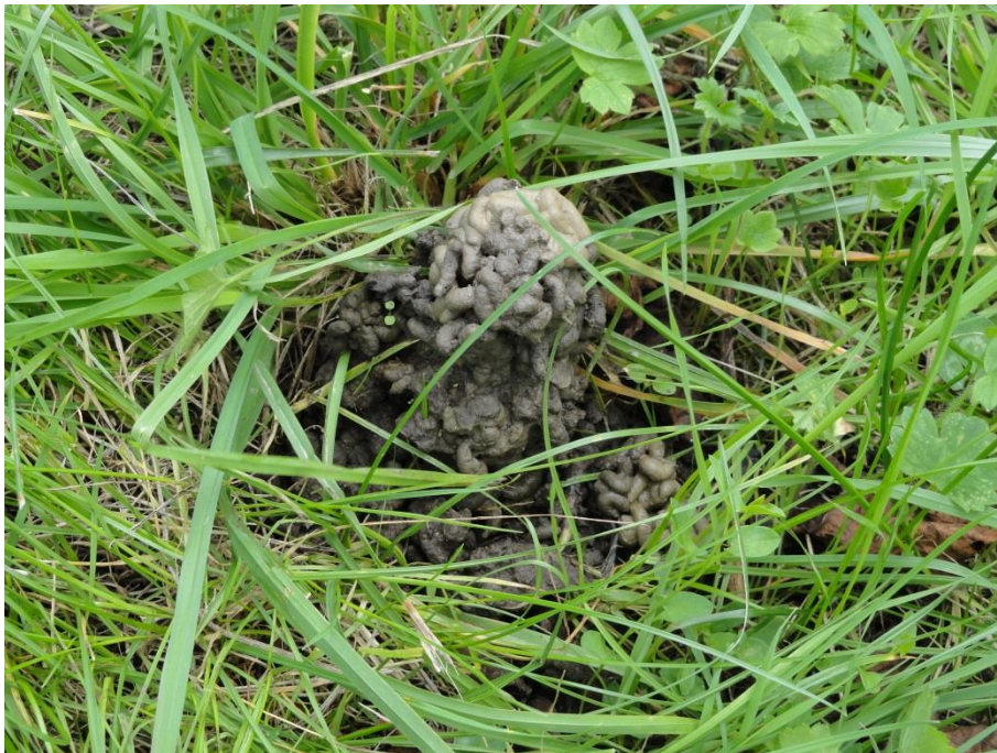
Slika 6: Vinogradniška tla – iztrebki deževnikov. V plodnih tleh je na 1 ha do globine 20 cm 7,5 t organizmov, od tega 900 kg deževnikov

manjšem deležu pa še rastlinski in živalski organizmi ter živ koreninski sistem rastlin). Ta organska snov gradi popolni sistem plodnosti tal in je še posebej v ekološki pridelavi velikega pomena.